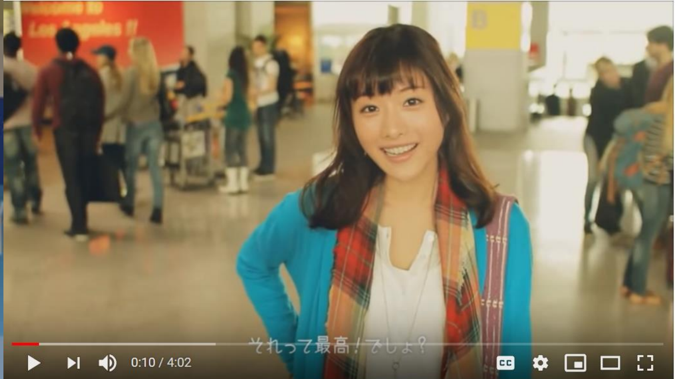
Satomi Ishihara TV Ad "AEON"